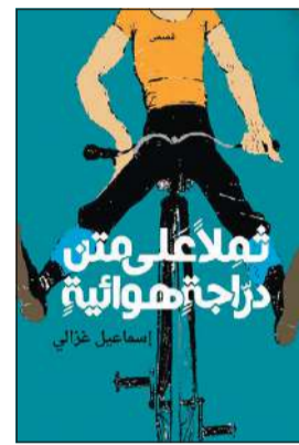
«نملا على متن دراجة هوائية»