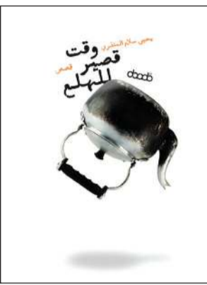
«وقت قصير للهلع»