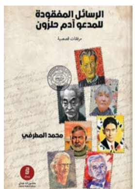
غلاف الرسائل المفقودة للمدعو آدم حلزون والمقطر وامراة عند النافذة